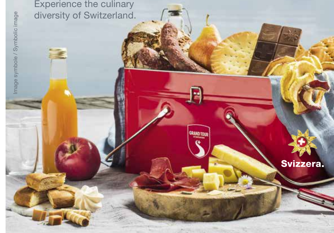
Image symbole / Symbolic image

Experience the culinary diversity of Switzerland.