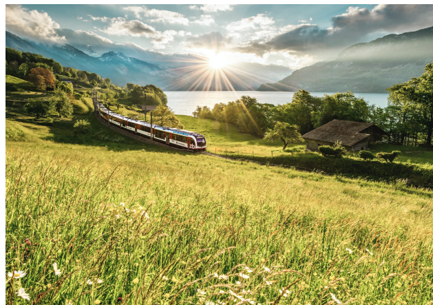
Luzern-Interlaken Express am Brienzersee, Berner Oberland