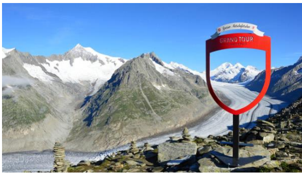
Foto-Spot Alesch Arena, Eggshorn