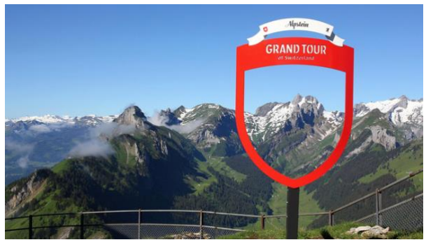
Foto-Spot Alpstein, Hoher Kasten