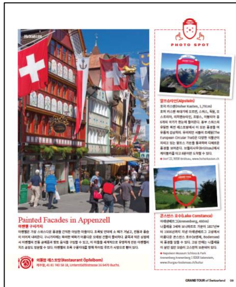
Medienbeitrag book-in-book Beilage Lonley Planet, Korea