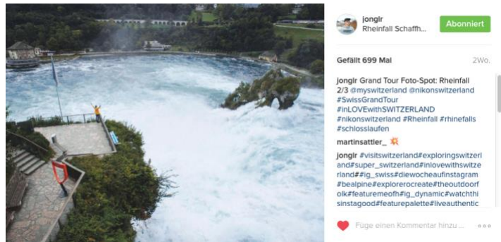
@jonglr, 4256 Follower, 699 likes