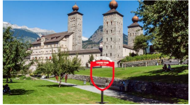
Foto-Spot Stockalperschloss, Brig