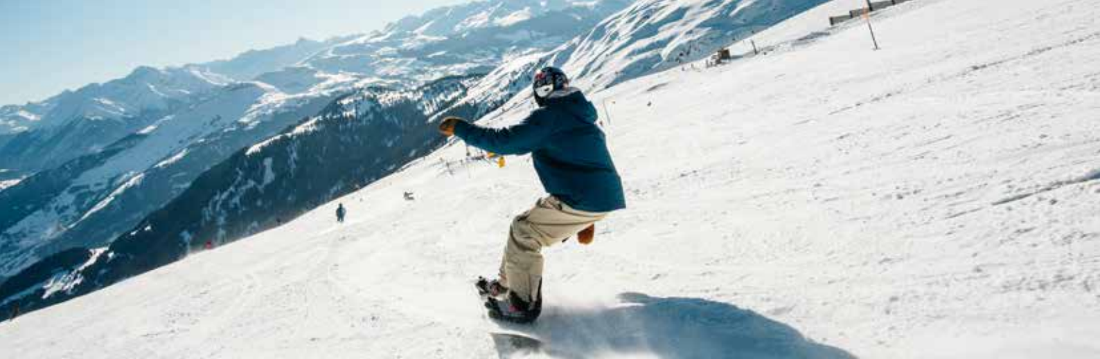
Laax, Graubünden