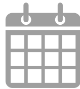
Veranstaltungen zum Vorzugspreis