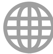
Präsenz auf STnet.ch