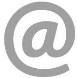
Banner im Branchen-Newsletter

Was bietet Ihnen die Mitgliedschaft bei Schweiz Tourismus (ST)? Damit sind Sie in der Schweizer Tourismusbranche umfassend vernetzt und profitieren von zahlreichen Privilegien.